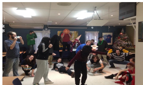
Activité avec le Théâtre 450

Divers programmes de prévention des dépendances offerts aux écoles.